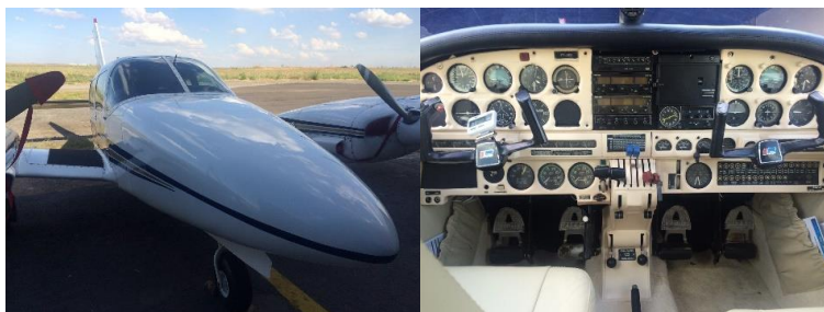
BI-Motor: Piper Seneca mit IFR, 6 Plätze, 400HP