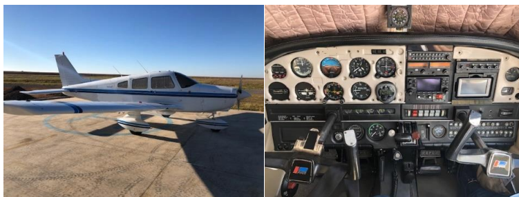
Mono-Motor: Piper Warrior II mit IFR, 4 Plätze, 160HP