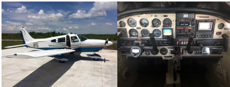
Mono-Motor: Piper Archer II mit IFR, 4 Plätze, 180HP